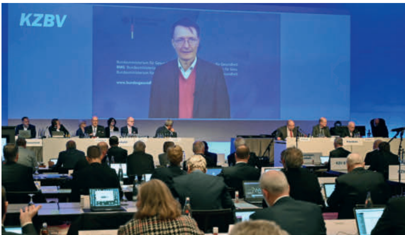
Die dreizehnte Vertreterversammlung der KZBV fand am 23. und 24. November 2022 in München in Präsenz statt. Bundesgesundheitsminister Prof. Dr. Karl Lauterbach (SPD) schickte ein Video-Grußwort, anders als bei der BZÄK-Bundesversammlung kurz zuvor.