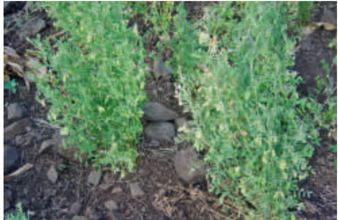
Die Linse stammt wahrscheinlich von der kleinasiatischen Wildlinse ab und bereicherte schon in der Steinzeit den Speiseplan unserer Vorfahren.

Die Nahrung der als Jäger und Sammler lebenden Menschen der Steinzeit bestand keineswegs nur aus Fleisch und gesammelten Früchten, sondern war bereits deutlich vielfältiger – Archäobotaniker der englischen Universität Cambridge entdeckten in Höhlen auf der griechischen Halbinsel Peloponnes und im südöstlichen Anatolien verkohlte Reste verarbeiteter Hülsenfrüchte wie Linsen, Wicke und Erbse (DOI: https://doi.org/10.15184/aqy.2022.143 ). Aufnahmen mit dem Elektronenmikroskop zeigten eindeutig zuzuordnende Samenfragmente, -hüllen oder Epidermiszellen. Mit der Radiocarbon-Methode wurde deren Alter auf ca. 11.000 v. Chr. (Griechenland) und mehr als 70.000 Jahre v. Chr. (Anatolien) bestimmt. Die Ergebnisse bestärken das aktuelle Verständnis, dass der Gebrauch von Pflanzen in der Altsteinzeit regulär auf stärkereichen Knollen und Gräsern wie Gerste und Hafer oder auch Nüssen wie Mandeln und Pistazien basierte, so die Forscher. Bemerkenswert sei die arbeitsintensive Verarbeitung eines breiten Spektrums an Pflanzen inklusive bitterer, astringenter und potenziell giftiger Flora sowie die Tatsache, dass diese über sehr lange Zeit fester Bestandteil des Ressourcenmanagements