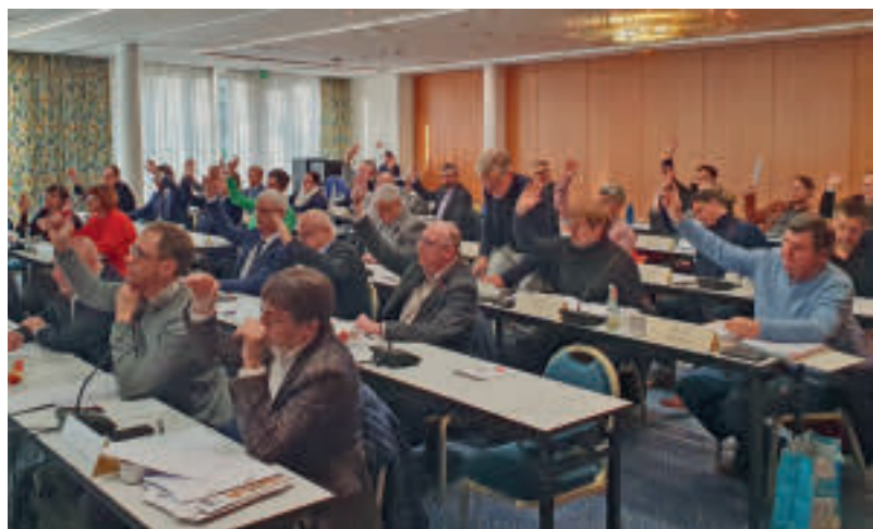
Die Kammerversammlung ist das höchste Gremium der Zahnärztekammer Sachsen-Anhalts. Im November 2022 tagten die Delegierten im Michel Hotel Magdeburg.

Die beginnende Adventszeit 2022 sei vor dem Hintergrund des Krieges in der Ukraine und der Probleme wie der Gaskrise eine