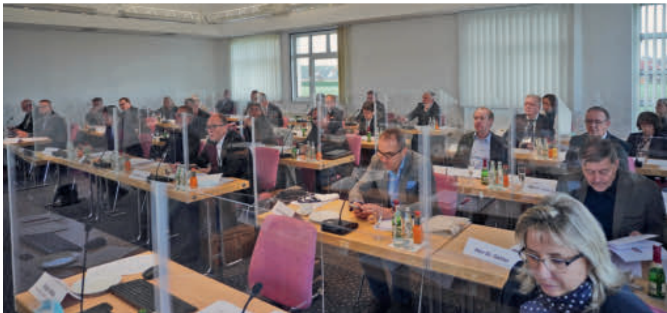
Die letzte Vertreterversammlung der Legislatur der Kassenzahnärztlichen Vereinigung Sachsen-Anhalt fand am 25. November 2022 im Verwaltungsgebäude in Magdeburg statt. 28 von 29 Delegierten waren anwesend.